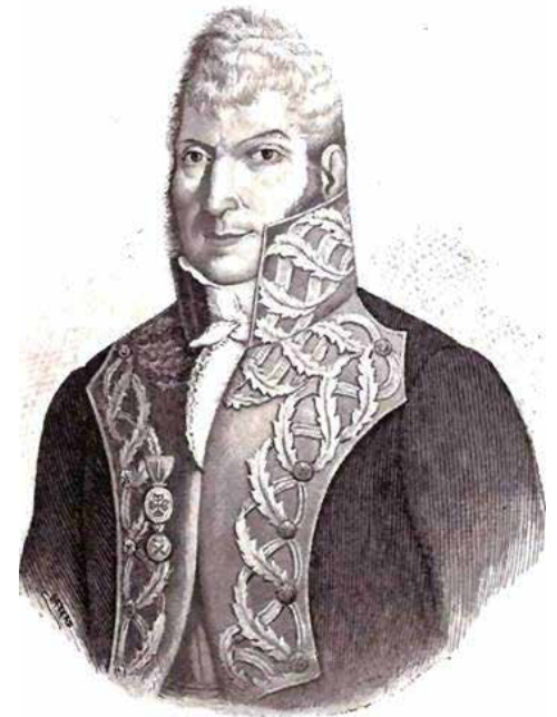
Don Francisco Javier de Venegas

XIII. Para asegurar la libertad de la imprenta y contener al mismo tiempo su abuso, las Cortes